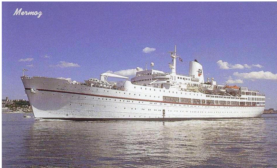
Le « Mermoz » à la Compagnie Française de Croisières